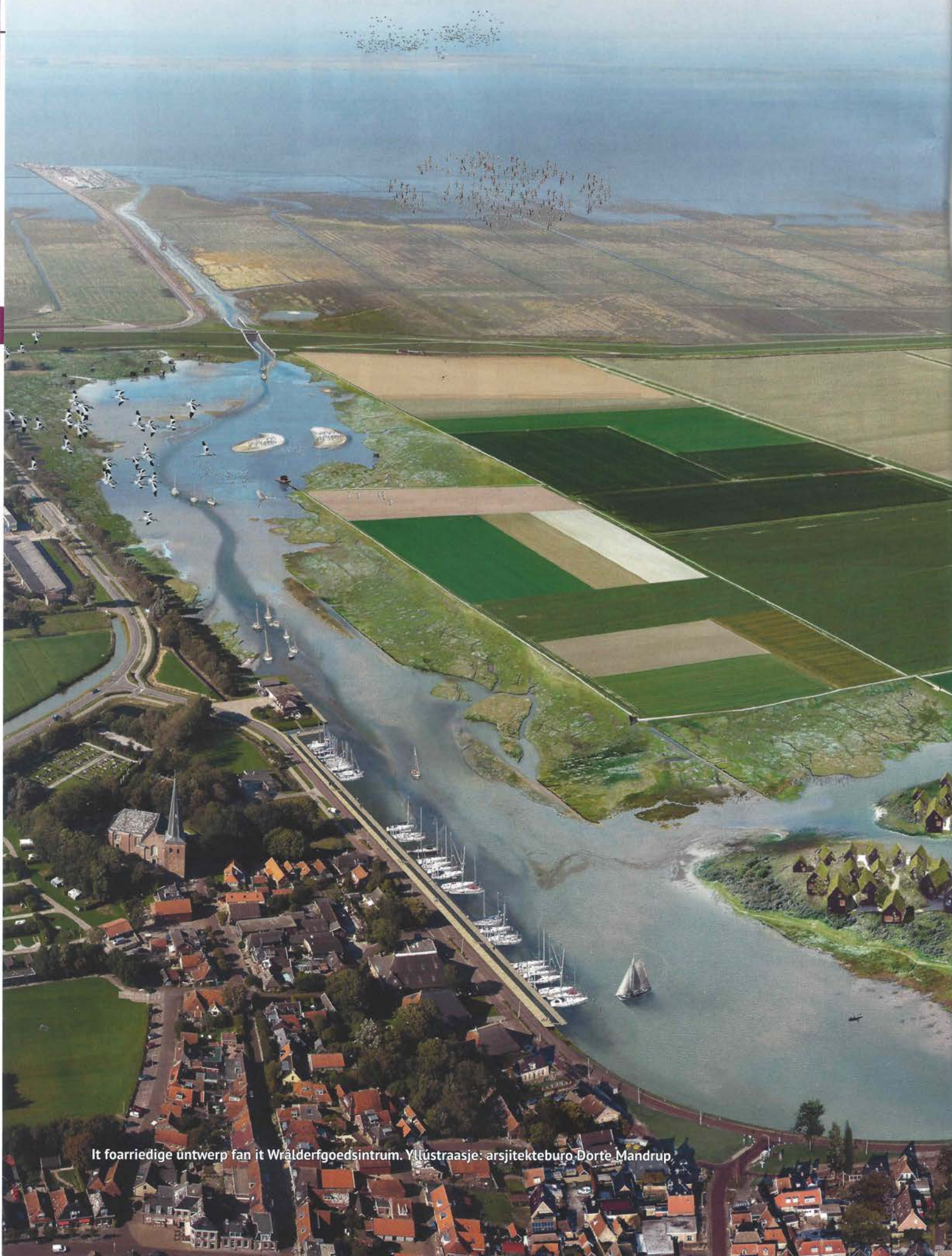
It foarriedige ûntwerp fan it Wrâldergoedsintrum. Yllustraasje: arsjitektebuero Dorte Mandrup