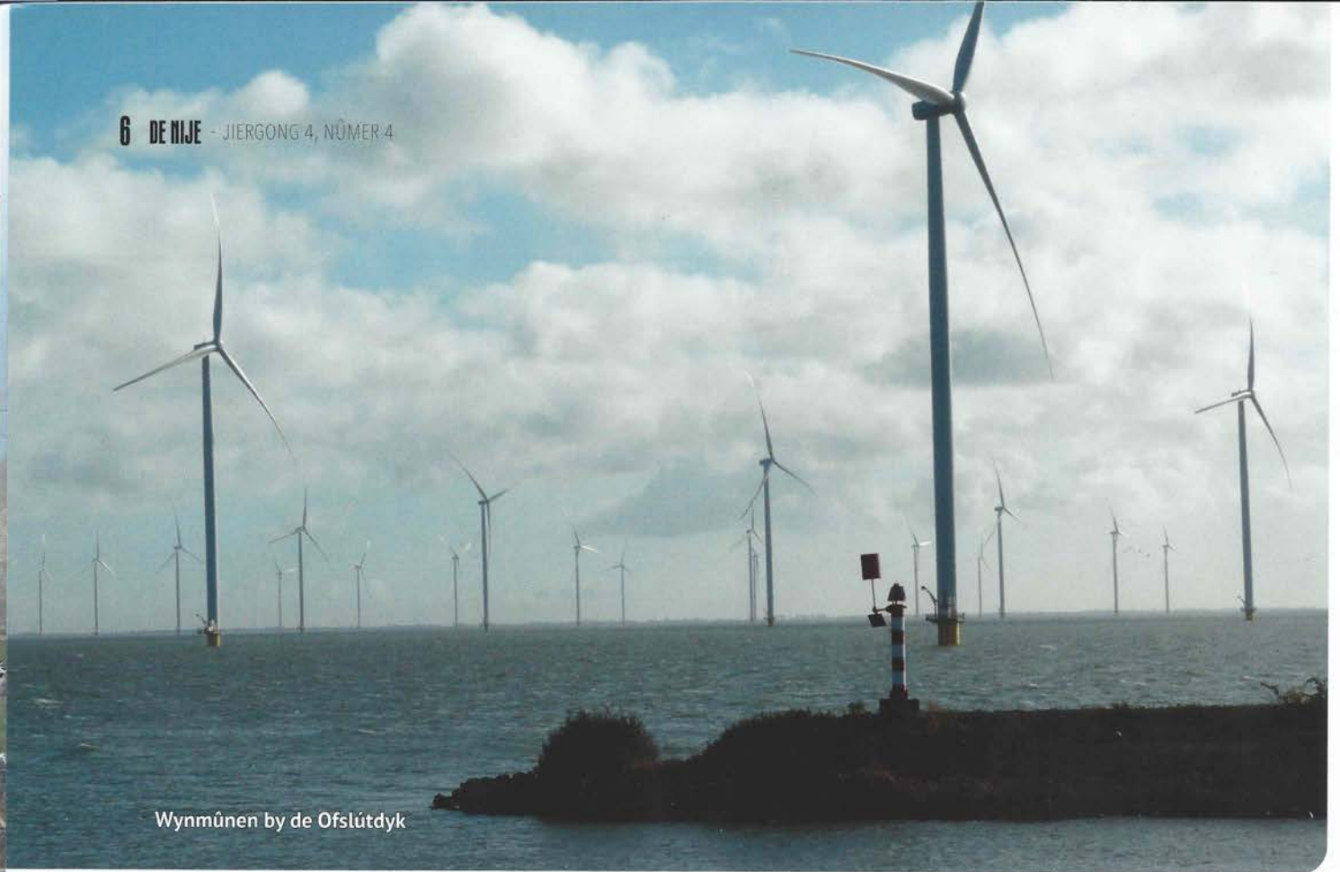
Wynmûnen by de Ofslútdyk